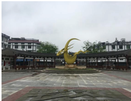
浙江省长台镇蜜蜂特色小镇