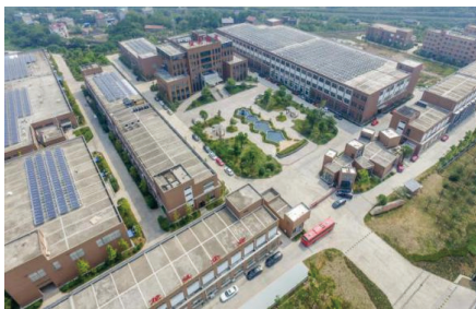
浙江江山恒亮蜂产品有限公司总部