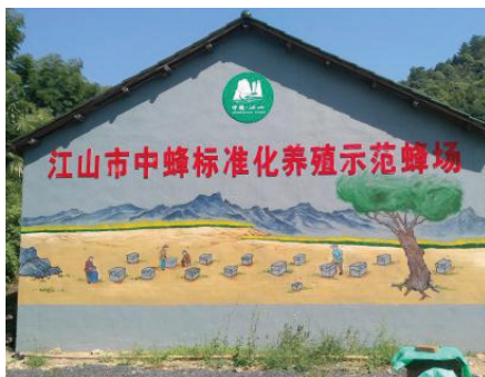
江山市中蜂标准化示范蜂场