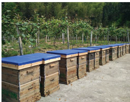
专业蜜蜂授粉示范基地（猕猴桃授粉基地）