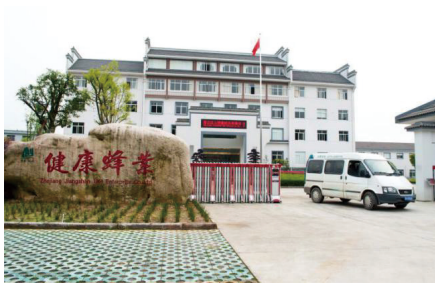
浙江江山健康蜂业有限公司总部