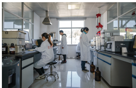
企业高标准原料与成品检测实验室

政府搭台，蜂业唱戏。在省、市有关部门的关心指导下，江山市委、市政府专门成立了“市蜜蜂产业领导小组”，从产业规划到资金扶持，从土地征用到项目审批，孕育了蜜蜂产业振兴行动、大三农蜂业扶持政策、蜂产业人才提升工程等一批批产业接续政策。首届中国（江山）蜜蜂文化节、中国蜂产品标准化生产高峰论坛、全国蜂业大会，一场场政府搭台的蜂业盛会推动着江山蜂业飞得更高更远。江山蜂业，走向世界。