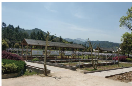
江山健康种蜂场良种选育基地