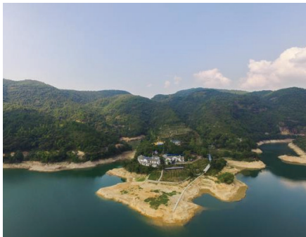
江山福赐得中蜂种蜂场良种选育基地