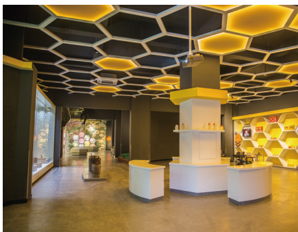
中国蜜蜂博物馆（浙江馆）